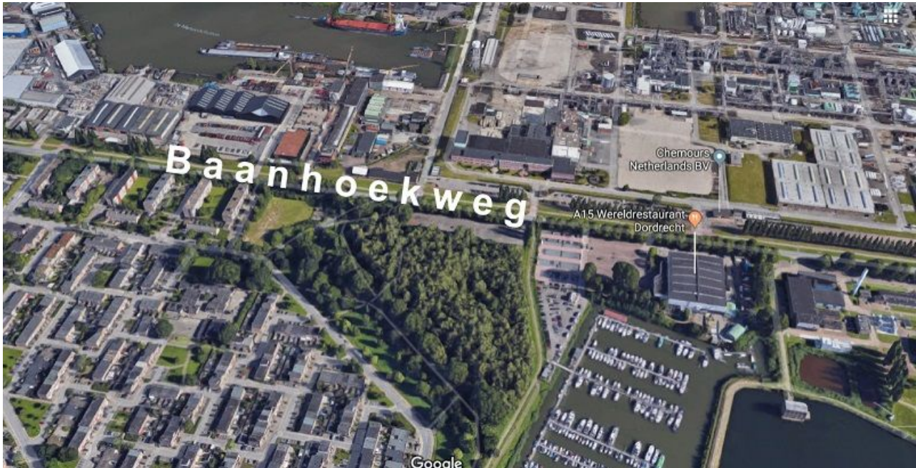
kaarten: Google | foto's: Lotti Hesper, Funda in Business